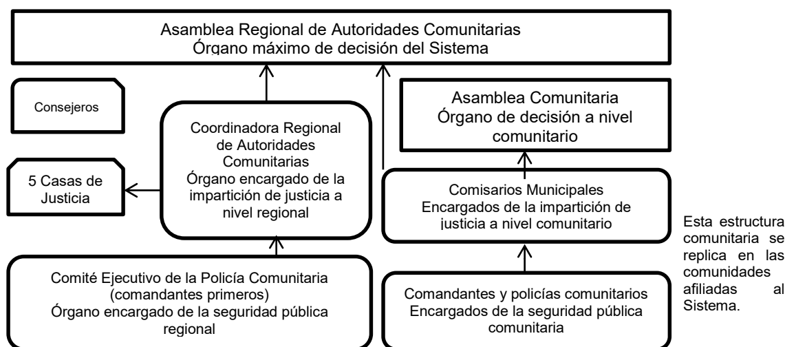
Figura 1. Elaboración propia. Se omite el Comité de la Figura Jurídica y el Comité de Coordinación y Gestión Interna por no tener funciones de seguridad pública e impartición de justicia.

125. A continuación se plasma la estructura del Sistema Comunitario de Justicia.