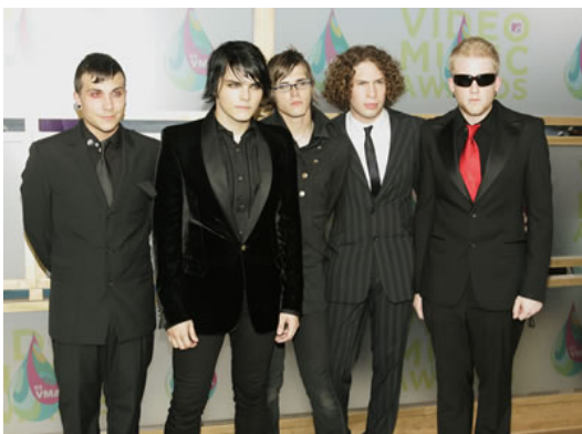
My Chemical Romance 9

La tercera generación emo está ligada a la comercialización disquera, a la promoción de nuevas bandas y a la explotación de la imagen, sumándose a esta moda muchos grupos que utilizaron el éxito de estos ritmos nostálgicos para adquirir fama y ventas. Así, aparecieron grupos muy diversos, con Nueva York como su capital y fueron exteniéndose desde entonces. Las bandas más escuchadas por los emos han sido desde entonces: My Chemical Romance , 30 Seconds To Mars , Fall Out Boy , Braid , Mineral , The Get Up Kids . My Chemical Romance se formó después del 11 de septiembre de 2001. Su líder, Gerard Way, escribió Skylines and Turnstiles por las imágenes de aviones que se estrellaban en las Torres Gemelas.