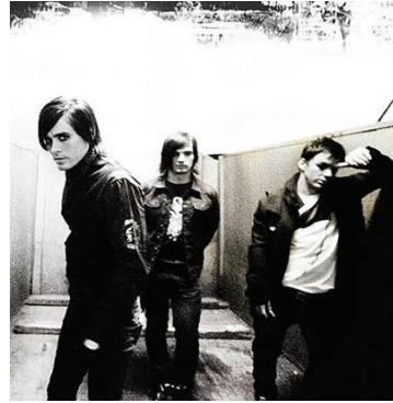
30 Seconds to Mars