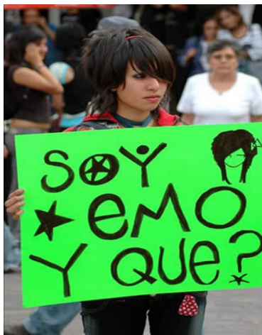
Popayán, Colombia - Lunes 28 de Julio de 2008

La dificultad de amar, de establecer lazos duraderos y compromisos a largo plazo también son características de las personalidades narcisistas que buscan satisfacción inmediata a sus necesidades de manera infantil y sin capacidad de demora, rasgos que se presentan en los jóvenes emos.