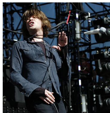
Taking Back Sunday