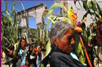
Baile de las Milpas en la comunidad de Chiepetepec Gro. Concurso sobre Derechos Indígenas, CNDH